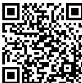
Figura 02 - QR Code do e-book Marketing Digital: o passo a passo completo para iniciantes

Entre as principais vantagens dos e-books está à possibilidade de no conteúdo inserir texto, vídeos, áudios, animações, infográficos e demais recursos que garantam maior estímulo cognitivo ao leitor. A seguir alguns QRcodes que apresentam modelos de livros digitais.